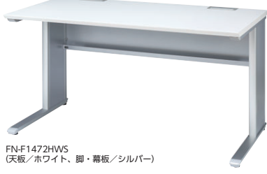
FN-F1472HW5 (天板/ホワイト、脚・幕板/シルバー)