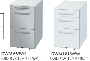
DWM-663WS (天板/ホワイト、本体/シルバー) DWM-L613WW (天板/ホワイト、本体/ホワイト)